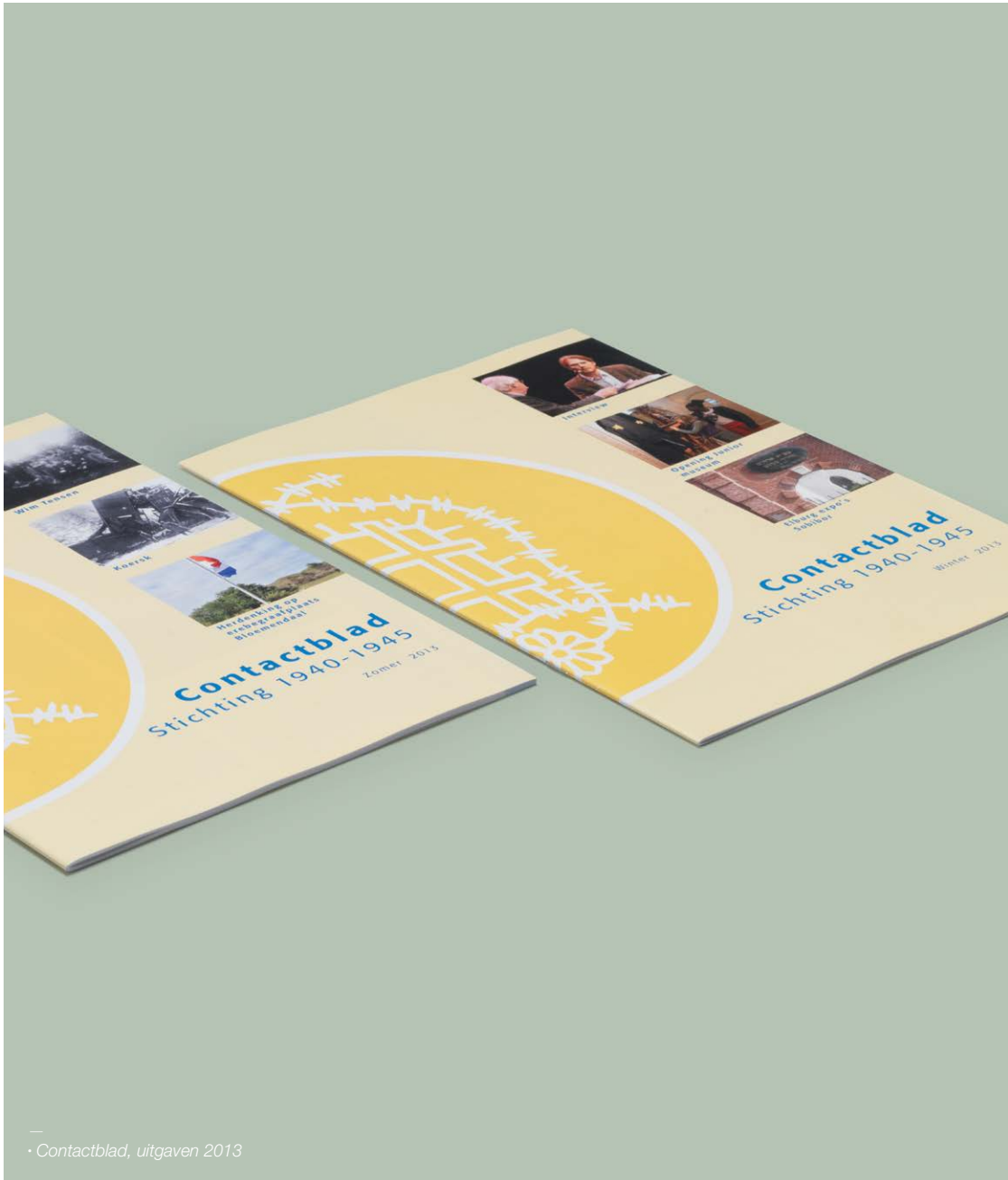
• Contactblad, uitgaven 2013